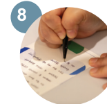
메모리얼 포스트 작성