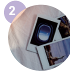
사진 파일 40여장 (추모영상과 조문보 제작용)