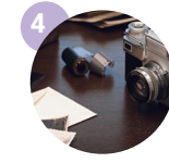
유품 10여 점 (고인이 애용하던 물품)