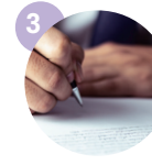
생애사 A4 반 장 이내의 텍스트