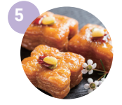
일정, 다과, 주차 등