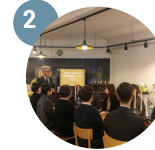
고인의 약력 소개